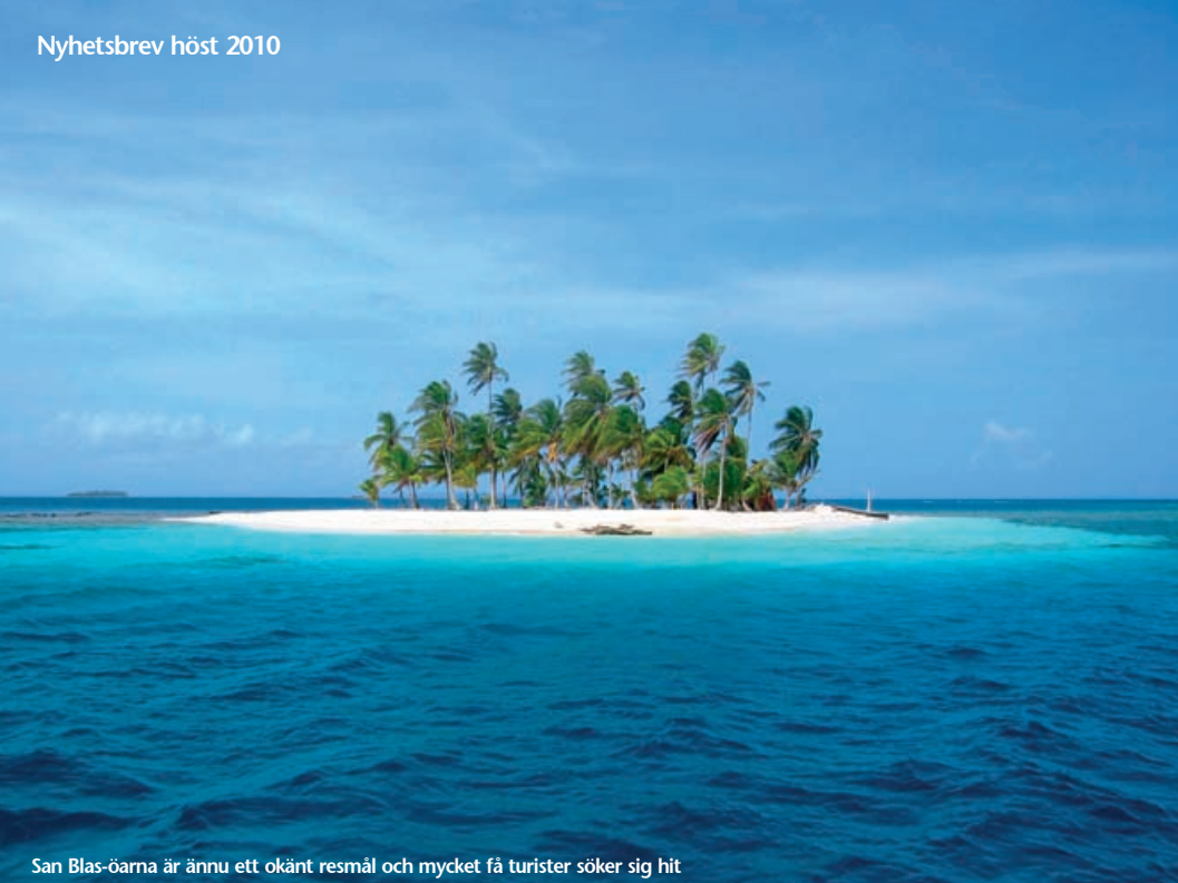
San Blas-öarna är ännu ett okänt resmål och mycket få turister söker sig hit