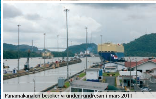
Panamakanalen besöker vi under rundresan i mars 2011