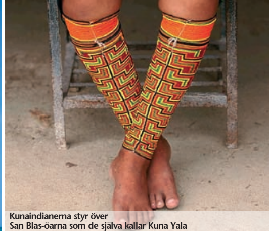
Kunaindianerna styr över San Blas-öarna som de själva kallar Kuna Yala